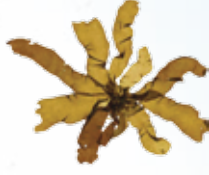
មាស់និងជួយធ្វើឲ្យស្បែកធូរ (Soothing Effect)